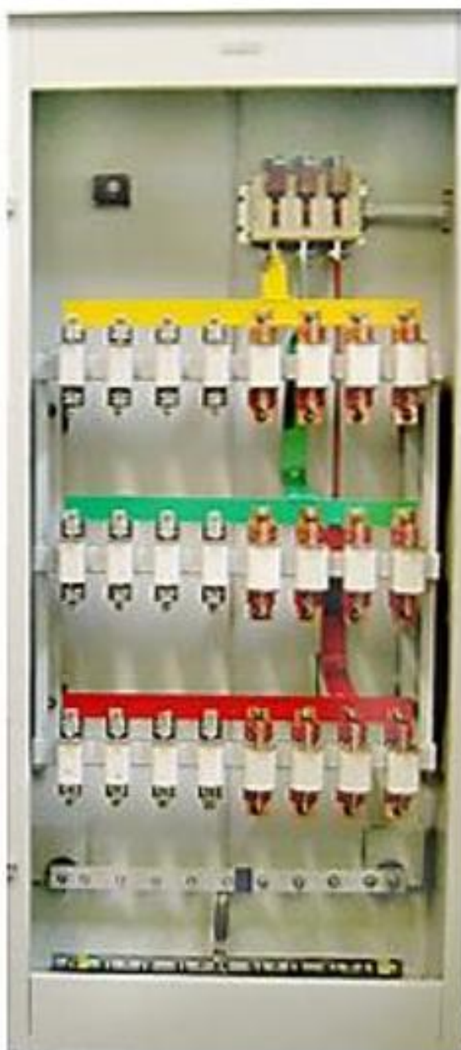
Силовой распределительный щит 0,4 кВ